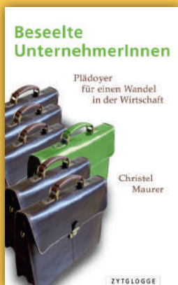
Christel Maurer Beseelte UnternehmerInnen. Plädoyer für einen Wandel in der Wirtschaft. Verlag: Zytglogge

Der dritte Strategietyp findet sich bei der 1851 gegründeten BBO Bank Brienz Oberhasli AG, die mit ihren ca. 30 MitarbeiterInnen die üblichen Dienstleistungen einer Bank anbietet, jedoch ihre unternehmerische Freiheit dadurch wahrt, dass sie ihre Geschäftstätigkeit auf zwei Standorte im Berner Oberland begrenzt. Dies befähigt sie zudem, die Wertschöpfung der Region zu stärken und eine individuelle Kundenberatung anzubieten. Auch angesichts der aktuellen Niedrigzinsphase erwirtschaftet die Bank solide Erträge und verfügt über eine starke Eigenkapitalbasis.