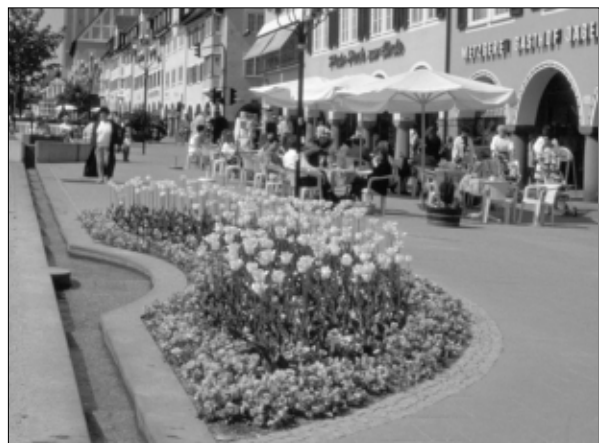
Hauptplatz Freudenstadt (D): Lebenswerter öffentlicher Raum

Um Kontakte zwischen den Bewohnern zu fördern, sind Treffpunkte wichtig, an denen Kommunikation stattfinden kann. Solche Treffpunkte, mit öffentlichen Sitzplätzen, sollten im Freien (auf Plätzen, in begrünten Höfen oder Parks), aber auch „unter Dach“ (in Passagen, Eingangsbereichen öffentlicher Gebäude, Gemeinschaftsräumen in Wohnhäusern) zur Verfügung stehen.