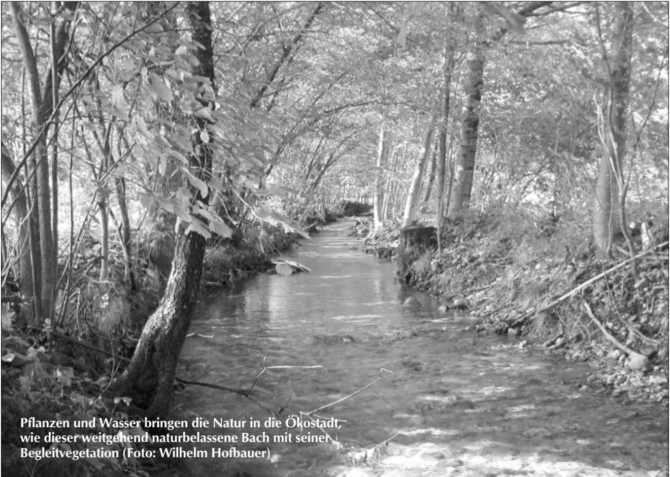
Pflanzen und Wasser bringen die Natur in die Ökostadt, wie dieser weitgehend naturbelassene Bach mit seiner Begleitvegetation

Das Institut für ökologische Stadtentwicklung erstellt ein Modellkonzept (siehe Seite 6); wollt ihr in einer Ökostadt leben?