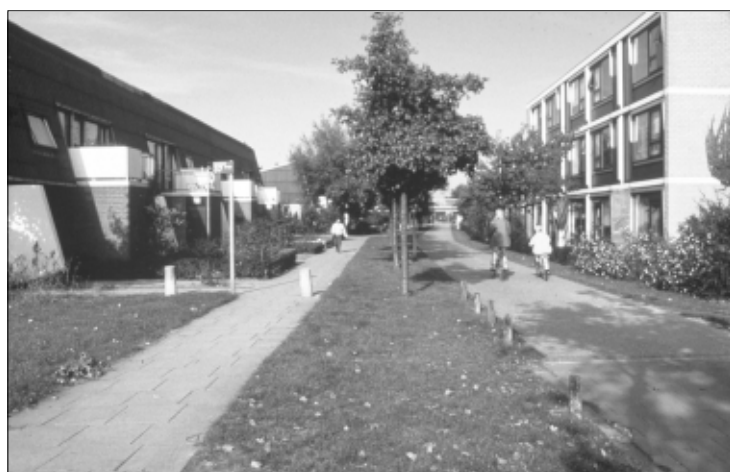
Rad-Fußweg Lelystad (NL): Komfort für Fußgänger und Radfahrer

Für etwas längere Wege, in die benachbarten Ortsteile, ist das Fahrrad am besten geeignet.