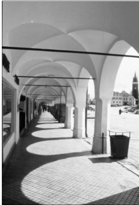
Hauptplatz Telc, Tschechische Republik: Möglichst durchgehender Witterschutz