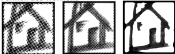
Formen wir das Wohnen!

Nochmals kurz die Highlights: zwei Hauptreferate: