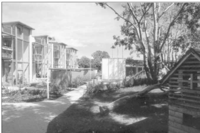
Solarhaus Wulzendorfstraße Wien: Wohnen mit der Sonne

Die bauliche Struktur an den für den Verkehr optimierten Standorten sollte durch die Orientierung der Gebäude zur Sonne bestimmt werden, um einen größtmöglichen Wärmegehalt durch Solararchitektur zu erzielen. Wo sich aus städtebaulichen Gründen eine andere Orientierung ergibt, sollen die Verluste durch Niedrigenergiebauweise minimiert werden. Auch hier bringen kompakte mehrgeschossige Gebäude durch ihren geringen Grundenergieverbrauch Vorteile gegenüber Einfamilienhäusern.