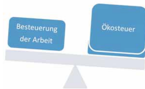
Nach der Reform (Soll-Zustand)