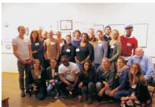
Gruppenbild vom 14. Vernetzungstreffen

Über 15 1zu1-Initiativen konnten sich an diesem spannenden Tag kennen lernen und über Kooperationen sprechen. Auch bereits entstandene Kooperationen unter den 1zu1-Initiativen wurden kurz vorgestellt. Das ganze Spektrum zwischen Schulprojekten, die gerade erst in Planung sind, bis hin zu Projekten und Privatpersonen, die seit Jahrzehnten in der österreichischen Entwicklungszusammenarbeit aktiv sind, war vertreten.