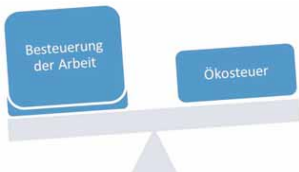
Vor der Reform (Ist-Zustand)