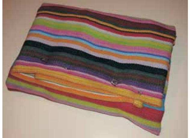
Eine Stoffverpackung mit zwei Büroklammern