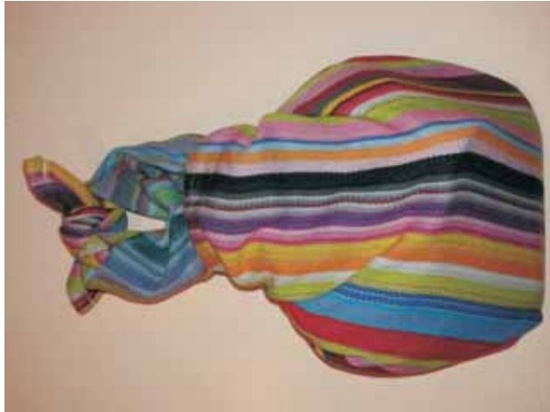
Eine Tasche aus nur zwei Knoten

Verpackung auf japanisch, auf nachhaltig, Von Josef Gansch.