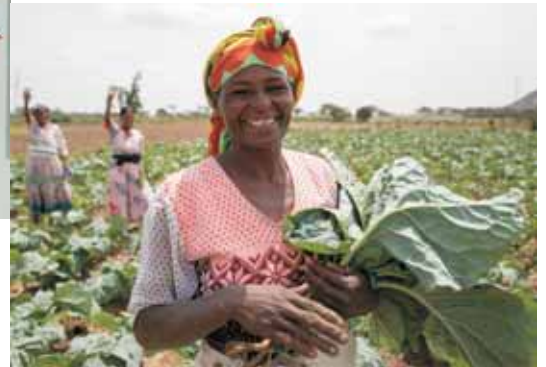
Kleinbäuerin in Äthiopien

Durch den Kauf eines Weihnachtsbillets von 10,- Euro kann einer Familie „Ein Päckchen Überleben“ zur Verfügung gestellt werden.