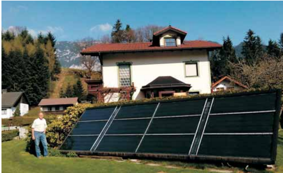
Siegeranlage – 48 Quadratmeter Solarkollektoren – Baujahr 1980.

NÖ-Sieger ist die Solarwärmeanlage von Familie Nemeth aus Biedermannsdorf, die bereits 1980 errichtet wurde und noch immer in Betrieb ist. Mit 49 Quadratmetern Fläche war die Anlage damals eine der größten Österreichs und produziert Warmwasser zum Waschen, Heizen und sogar für das Schwimmbad.