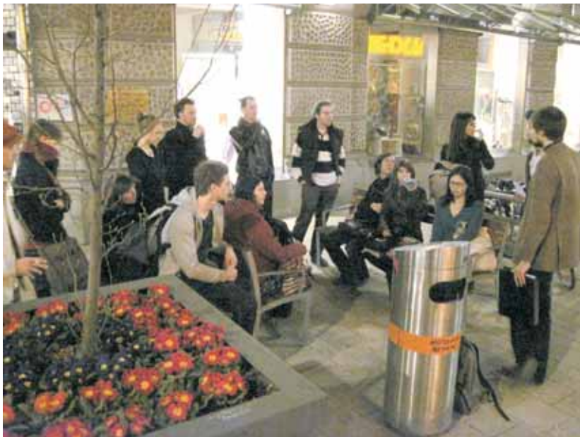
Öffentliche Plätze: Ein Thema, das manchmal in Vergessenheit gerät. Wir haben uns an den Autoverkehr und seinen Flächenbedarf gewöhnt.

Für die nächsten zwei Jahre planen wir mit der „CleanEuro-Radtour“ ein ganz neues Format, mit dem wir die Möglichkeit haben, verschiedene Orte zu besuchen und neue Schwerpunkte zu setzen. Diesmal sollen vor allem Orte im Mittelpunkt stehen, die alternative Konsumformen ermöglichen. Wir denken dabei beispielsweise an Bioläden, Second-Hand-Geschäfte, FoodCoops, Gemeinschaftsgärten, Reparaturbetriebe und Kost-Nix-Läden.