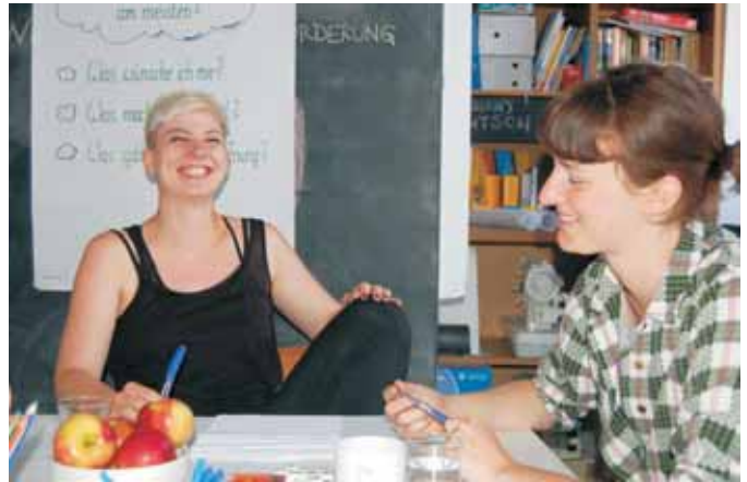
Gute Stimmung bei der Wiener Schreibwerkstatt im Juni

So wird es über ganz Österreich verteilt Schreibwerkstätten geben, in denen gemeinsam an prägnanten, witzigen und zum Denken anregenden Slogans gebastelt wird. Gemeinsam mit einem Experten von Loesje, die kreatives