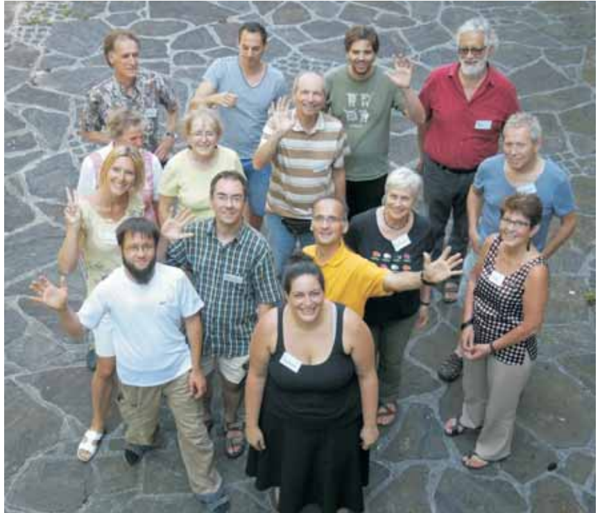
Gruppenfoto vom Sonntag, aufgenommen von unserer Trainerin Gerhild Trübswasser.

Viele nächste Schritte wurden geplant und in Angriff genommen, und wir sind dankbar für die tolle SOL-Familie: Nach diesem Wochenende voll positiver Energie starten wir motiviert und gestärkt nach vorne in die Zukunft!