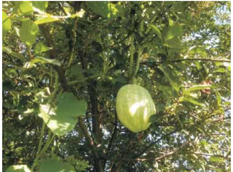
Kürbisse wachsen sogar unter Obstbäumen.

Eine weitere Notwendigkeit, die Zeit beansprucht, ist das Entfernen der Kerne. Es dauert, bis alle herausgekratzt sind, vor allem, wenn man als Gärtnerin einige für Anbauversuche aufheben will. Auf einem altmodischen Kaffeefilter lässt sich das Trocknen sämtlicher Samen - egal ob Kürbisse oder Tomaten, Gurken, Zucchini - gut bewerkstelligen. Mit einem Kugelschreiber im trockenen Zustand beschriftet (Sorte und Jahr), spare ich mir sogar das Sackerl, denn die Samen haften fest auf dem Filter und lassen sich später trotzdem leicht ablösen.