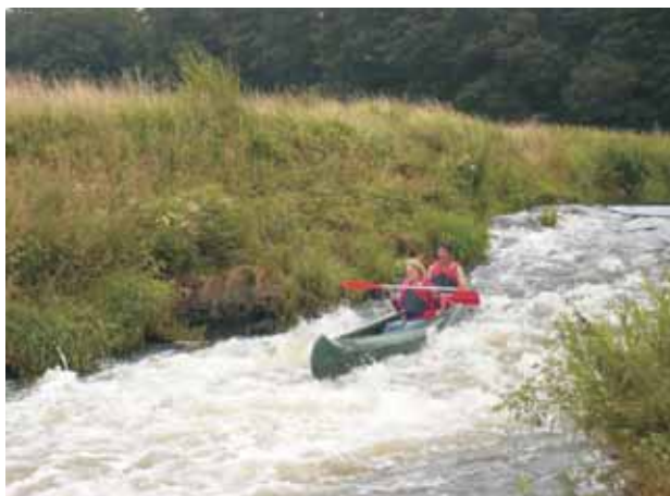
Kanufahren auf der Hase

Aber ich bin immer noch ein ganz normaler Erdenbürger. Ich fahre Auto, esse Fleisch, habe (noch) viel zu viele Sachen und bin Raucher.