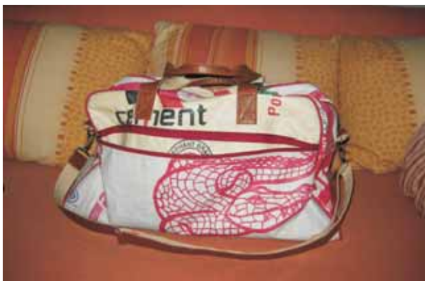
Die besagte Tasche ...

Christoph: Etwas schräg wurde ich schon angeguckt, als ich mir zu Weihnachten eine neue Tasche gewünscht habe und meinen Kindern genau gesagt habe, welche es denn sein soll, nämlich die von Gepa aus indischen Zementsäcken, fair produziert für 80 €. Mittlerweile liebe ich diese Tasche und werde sie so lange nutzen, bis sie auseinanderfällt.