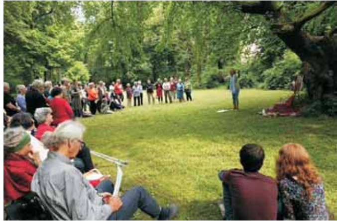
Treffen in Jahnishausen

Und beinahe alle waren da, allen voran die Gründungsmitglieder gASTWERKe , Schloss Tonndorf, Sieben Linden, Lebensgarten Steyerberg, Schloss Tempelhof, neue Lebensgemeinschaften und eine ganze Reihe von interessierten Einzelpersonen wie ich - knapp 90 Menschen, darunter viele Kinder, die