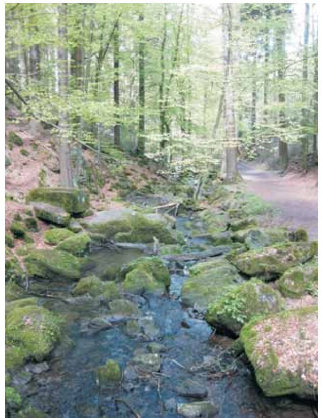
Einladung zum Abschalten ...

Auch habe ich mich mit meinem Kleidungskonsum genauer auseinandergesetzt. Wenn mir etwas gefällt, schaue ich mir zuerst das Label an und informiere mich über Plattformen. In 90 Prozent der Fälle komme ich zu dem Ergebnis: Das brauche ich nicht! Das ist nicht fair produziert! Das kaufe ich nicht!