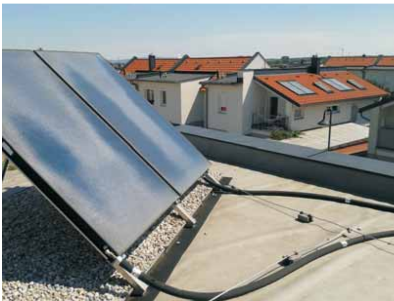
Aufgeständerte (Vordergrund) und dachintegrierte Solaranlage (Hintergrund).