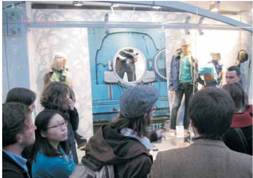
Bei einem CleanEuro-Stadtpaziergang: Vor einem Kleidungsgeschäft reden wir über die Herkunft und Herstellungsbedingungen der Textilien.

Seit der Erfindung des Projektes 2006 wurden ca. 3000 Menschen direkt erreicht, die an einem Workshop oder Stadtrundgang teilgenommen haben. Wir haben uns dabei in den verschiedenen Projektphasen auf verschiedenste Zielgruppen fokussiert – z.B. Jugendliche, Jungeltern, türkischsprachige Menschen und europäische MultiplikatorInnen.