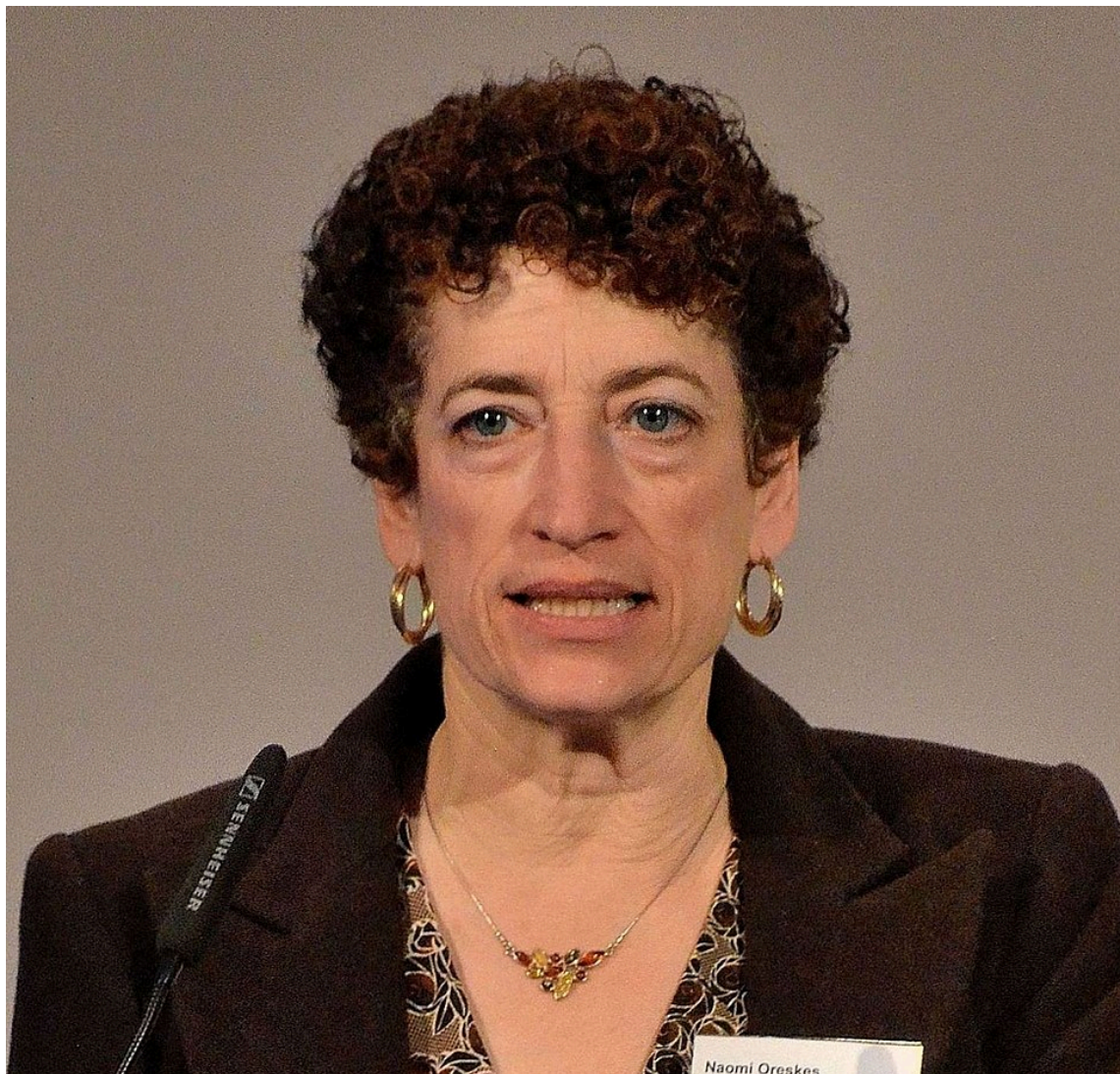
Das Foto zeigt Naomi Oreskes; Autor: Adrian Grycuk

Das Buch „Merchants of Doubt“ von Naomi Oreskes und Erik M. Conway beschreibt, wie im Auftrag großer Konzerne Zweifel an Forschungsergebnissen gesät wurden und werden, um Gesetze gegen Tabakregulierung und Klimawandel zu verhindern.